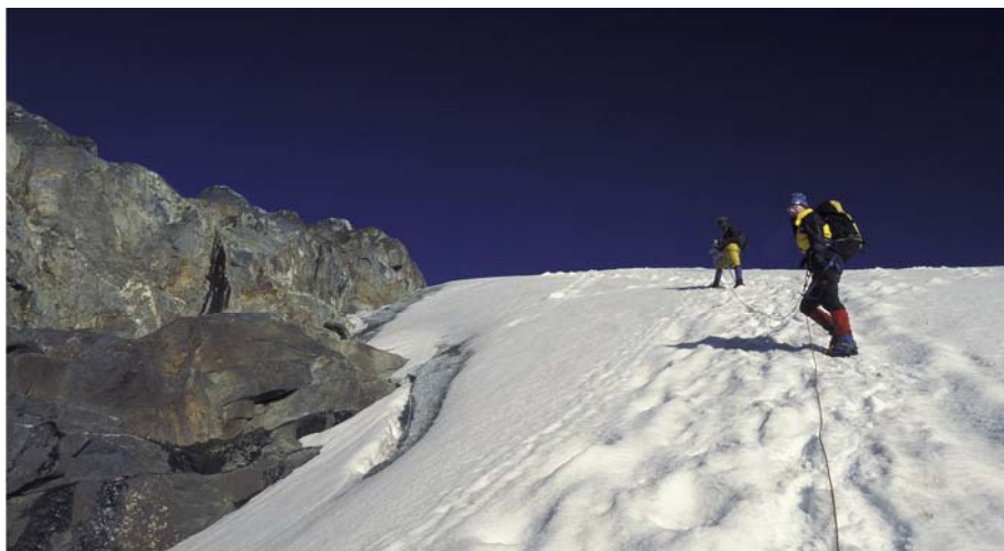
"Knüppelpfade" im Dschungel und Gletscheranstieg am Stanley-Plateau