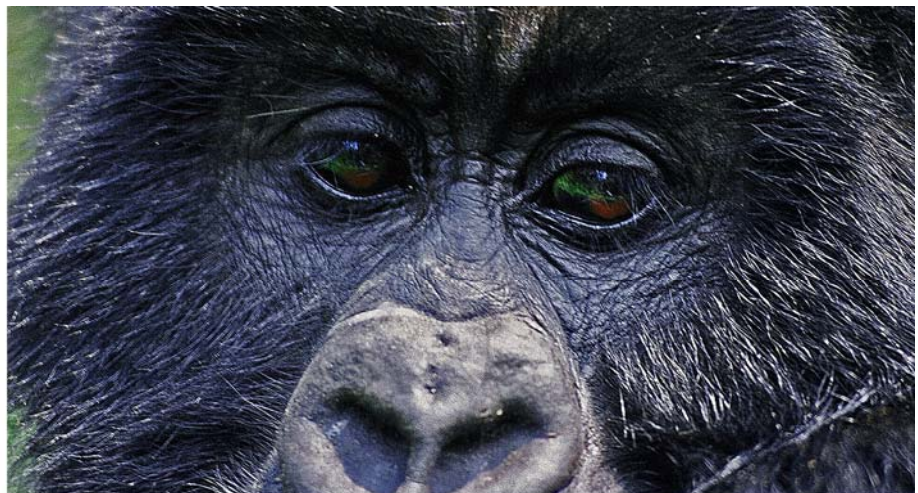
Vertraute Blicke - kein Wunder, die DNS von Mensch und Gorilla ist zu 98,4 % ident!