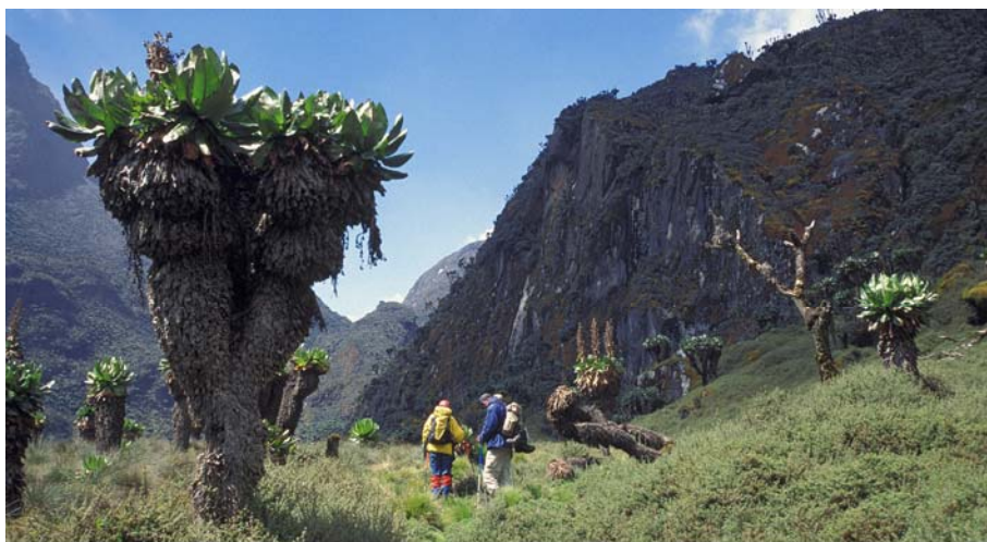
„Der Regenmacher“ und seine einzigartige Vegetation: Riesenseneceen und immerfeuchter Bergnebelwald

Aus dem Buch „Berge Afrikas“; Sepp Friedhuber und Günter Guni, 2006