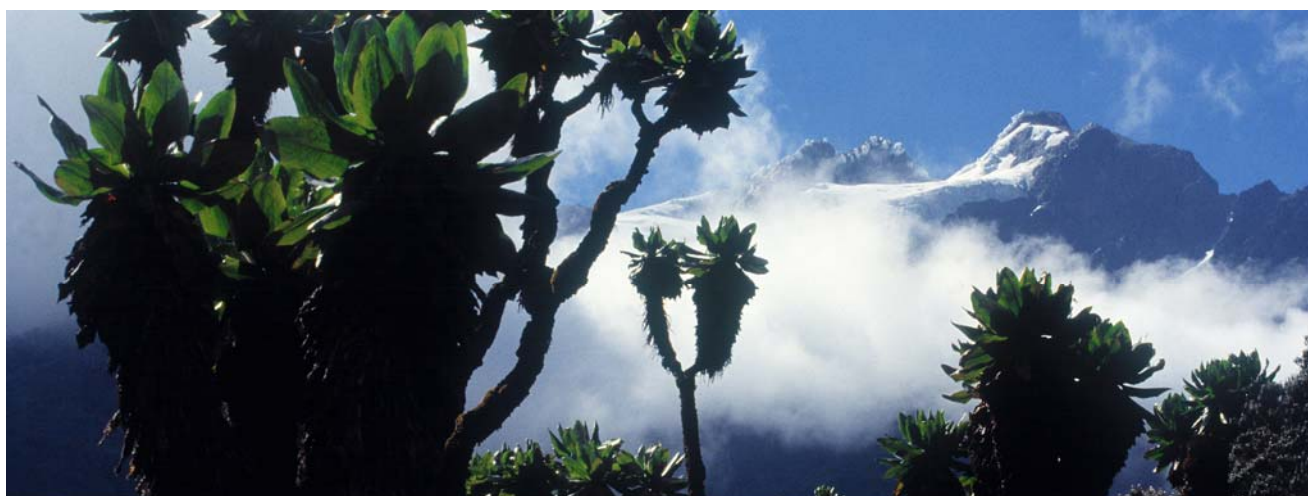
Ruwenzori: Tropische Riespflanzen und Gletschereis am Äquator