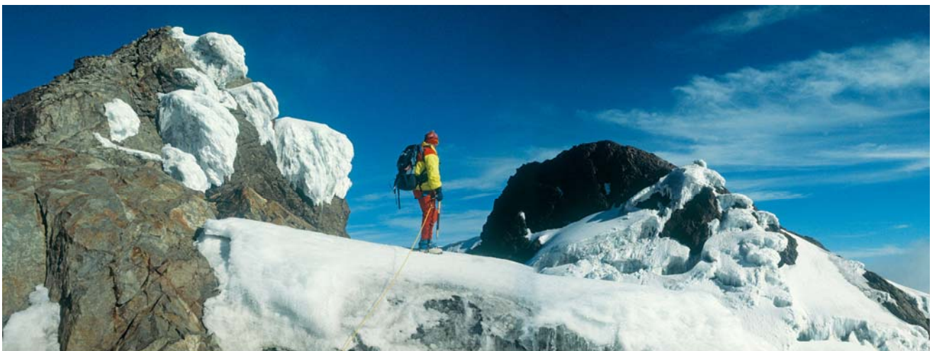
"Lunae Montes", die sagenhaften Mondberge

Abwickler: Die Abwicklung allfälliger Ansprüche erfolgt durch den Verein der Interessensgemeinschaft der Pauschalreiseveranstalter, p. A. Europäische Reiseversicherung AG, Augasse 5-7, A-1090 Wien. Telefon: 0043/1/3172500. Sämtliche Ansprüche sind bei sonstigem Anspruchsverlust innerhalb von 8 Wochen nach Eintritt der § 1 Abs. 3 der RSV genannten Ereignisse anzumelden.